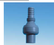
Rückschlagventil mit Entlüftung / non-return- valve with venting 3004.53.00