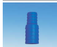
Entlüftungsstutzen / vent connection C1.0605.01