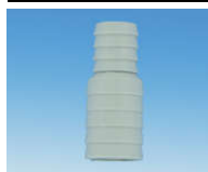
Schlauchstutzen / hose clip C1.0608.02