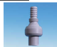
Rückschlagventil / non-return-valve 3004.02.00