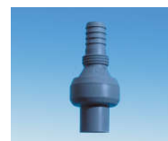
Rückschlagventil mit Entlüftung / non-return- valve with venting 3004.53.00