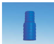
Entlüftungsstutzen / vent connection C1.0605.01