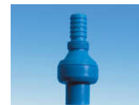
Filter / filter 3006.01.00