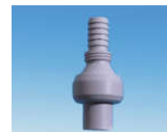
Rückschlagventil / non-return-valve 3004.02.00