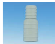
Schlauchstutzen / hose adapter C1.0608.02