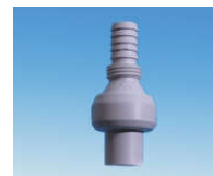
Rückschlagventil / non-return-valve 3004.02.00