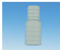
Schlauchstutzen / hose clip C1.0608.02