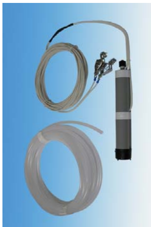
Artikel: 1900.57.00 Tauchpumpe COMET-COMBI 12-2T