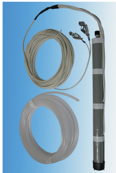
Artikel: 1910.57.00 Tauchpumpe COMET-COMBI 12-4T