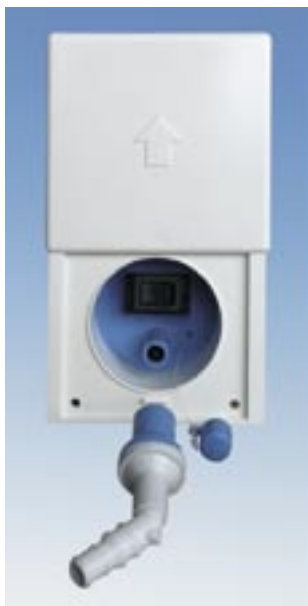
3012.06.00 Dusche-Außenanschluss Einbaumaße: Ø 58 mm, 55 mm tief Schlauch 10 mm