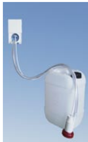
3011.06.17 Wasserversorgung Set bestehend aus: Wassereinspeisung, Tauchpumpe LUX-PLUS, Kabel und Schlauch 1,5 m sowie Wasserkanister mit Tankdeckel-einsatz und Verschlusskappe