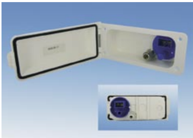
3500.06.19 Versorgungsklappe Wassereinspeisung Caravan-Versorgungsklappe für den Anschluss einer Tauchpumpe zur Wasserversorgung aus einem externen Kanister WASSER: Steckkupplung mit Stecker für Schlauch Ø 8 mm ELEKTRO: Steckdose zur Stromversorgung der Tauchpumpe