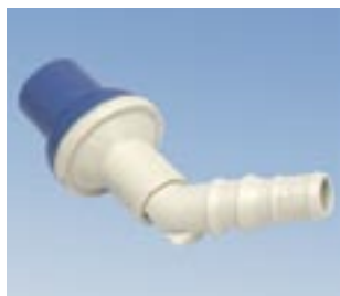
3932.05.00 Adapter zu Dusche-Anschluss