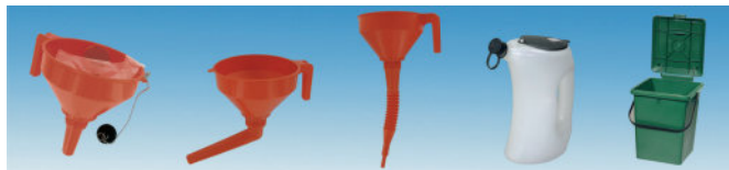
8930.13.00 Trichter / funnel