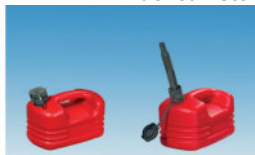
8421.13.12_05 komplett montiert completely assembled