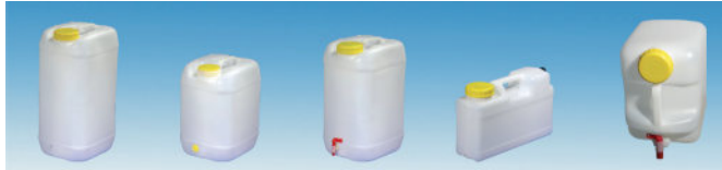
8001.82.10_30 8002.82.20_20 8003.82.10_25 8001.82.10_12 8043.82.10_20 DIN 96 / DIN 51