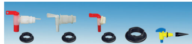
8920.13.01 alle Gewinde 3/4" / all threads 3/4"