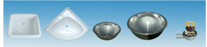
8715.06.00 350 x 280 mm 8716.06.00 345 x 345 mm 8730.20.00 295 mm 8731.20.00 335 mm 8770.00.00 Ablaufgarnitur/ drain fitting