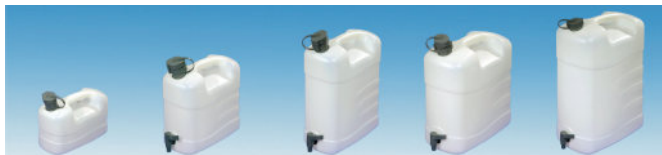
8401.58.12_05 8403.58.12_10 8403.58.12_15 8403.58.12_20 8403.58.10_35 ohne Ausgießer / w/o pourer