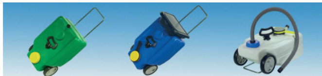
8600.63.10_25 Frischwasser / freshwater