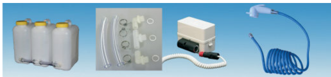
8910.00.00 Kanisterverbinder canister connector set