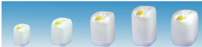
8201.82.10_05 DIN 51 8201.82.10_10 DIN 51 8101.82.10_20 DIN 61 8101.82.10_25 DIN 61 8101.82.10_30 DIN 61