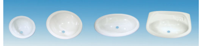
8700.06.00 290 mm 8701.06.00 360 mm 8702.06.00 450 x 275 mm 8704.06.00 450 x 345 mm