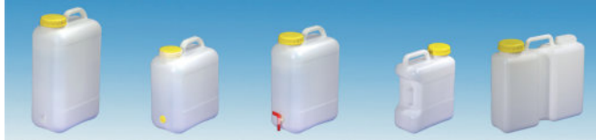
8001.82.10_19 8002.82.20_13 8003.82.10_16 8011.82.10_10 8011.82.10_13 Aqua-Case