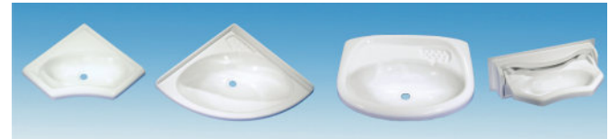
8705.06.00 345 x 345 mm 8706.06.00 420 x 420 mm 8707.06.00 450 x 345 mm 8720.06.00 540 x 315 mm