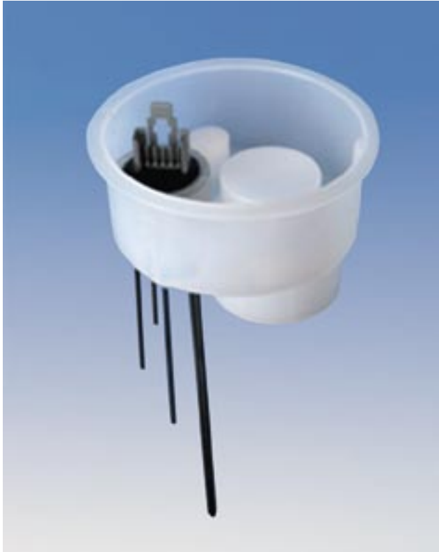
3420.00.01 Wasserstandssensor Frischwassertank